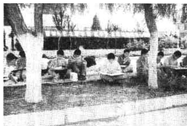
5月18日,市实验小学举办了有300多名同学参加的“益智”杯第二届现场书画比赛,同学们的作品内容丰富多样,形式活泼多样,充分反映了少年儿童对美好生活的向往和对学习的热爱。 (张天强 摄)

本报讯 5月15日,本报曾报道了坐台小姐设局,将一江苏老板绑架并实施勒索,被公安机关迅速侦破的新闻。就在该报道登出的第二天,我公安机关再次侦破一起十分相似的绑架案。在此,公安部门警告,那些胆敢以身试法者,切勿心存侥幸,否则必将自投法网。 4月30日下午3时许,刘家批发市场一经销中心老板来到东营公安局报案,称4月28日20时许,其驾车到东赵村送人时,被几名作案分子绑架,先将其拉到井下丰收村废弃平房内殴打,后又将其劫持至某招待所,威逼其交10万元赎金,后还价,绑匪同意让其交6万元赎金。4月29日15时许,该老板让其朋友存到绑匪提供的帐户上3万元钱,后被绑匪取走。30日上午,绑匪见其在拿不出钱,遂逼其写下一张3万元欠条,同时将其手机及8000元借据押在手中将其放回。 刑警大队接报后,迅速展开侦破工作,通过调查,将涉案犯罪嫌疑人身份及住址查清,并于5月16日20时30分在金洲花园家属区内将4名犯罪嫌疑人一举抓获。后又经过缜密侦查,于17日将另外三名犯罪嫌疑人刘某、张某、仇某分别在住处抓获。 经审讯,上述7名犯罪嫌疑人经过事先密谋,于4月28日20时许,通过与受害者有一暧昧关系的犯罪嫌疑人苏某联系,将该老板骗至东赵村,实施了绑架行为。目前,7名犯罪嫌疑人已被刑事拘留。(开言 春兴)