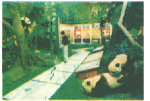
5月22日,中国第一家以大熊猫物种为主的博物馆——中国卧龙大熊猫博物馆正式开馆。这是以高科技手段再现大熊猫生活环境的生活厅。

新闻热线 8328691 8331392 电子邮箱 dyrb@sina.com 网址 http://www.dyrb.com