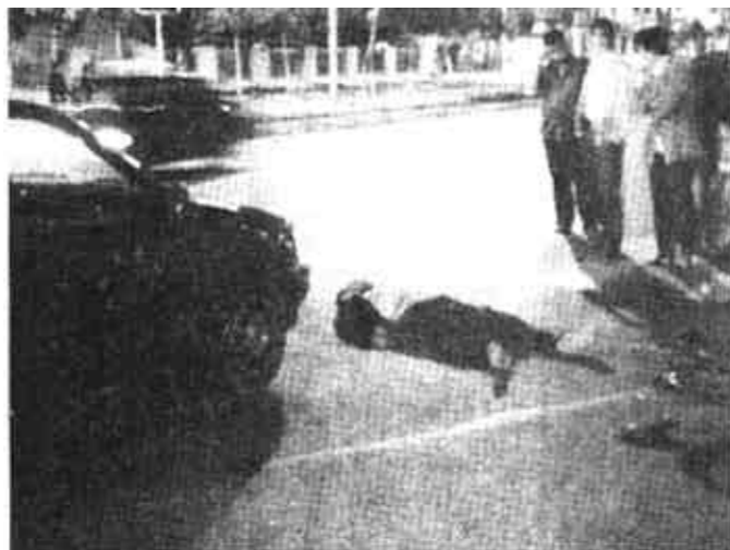
21日晚九点在东城曹州路与运河路交叉口发生一起交通事故。事故再次提醒人们,一定要遵守交通规则,以免发生危险。

在短短的三个月里,全区共注册商标8个,拟注册商标5个,形成了以黄河口为主题的系列商标体系。目前,该区正在筹备召开黄河口商标广告战略研讨会,邀请省、市有关专家、经济专家和部分大中型企业代表参加,将全方位展示建区以来全区注册商标和品牌,召开产品展示会,邀请市内外企业参加,并确定黄河口商标广告发展战略规划实施方案,研究和开发新产品、新项目,建立油地军联合发展经济战略。 (王玉亭 李寿瑞 高立生)