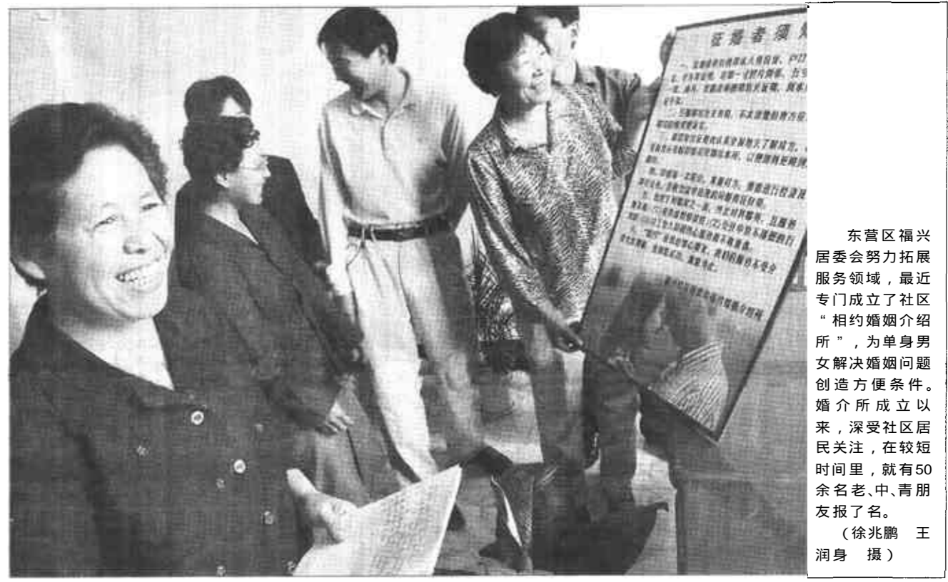
东营区福兴居委会努力拓展服务领域,最近专门成立了社区“相约婚姻介绍所”,为单身男女解决婚姻问题创造方便条件。婚介所自成立以来,深受社区居民关注,在较短时间内,就有50余名老、中、青朋友报了名。